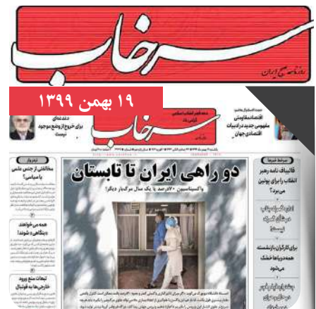
اقتصاد مقاومتی، مفهومی جدید