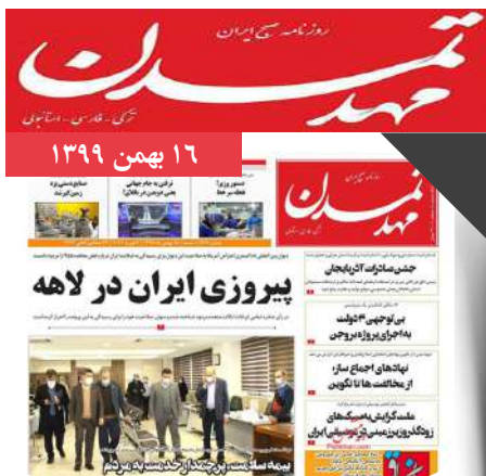
صادرکنندگان برگزیده معرفی شدند؛