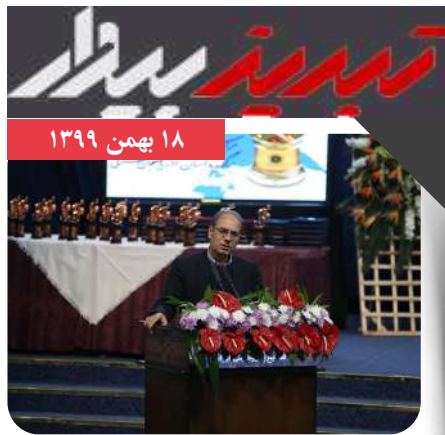
۷۰ درصد مشکلات اقتصادی کشور