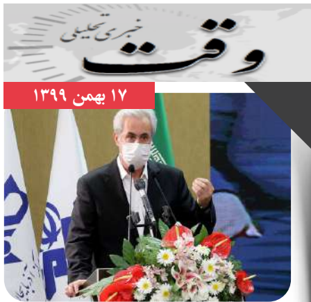
استاندار آذربایجان شرقی: