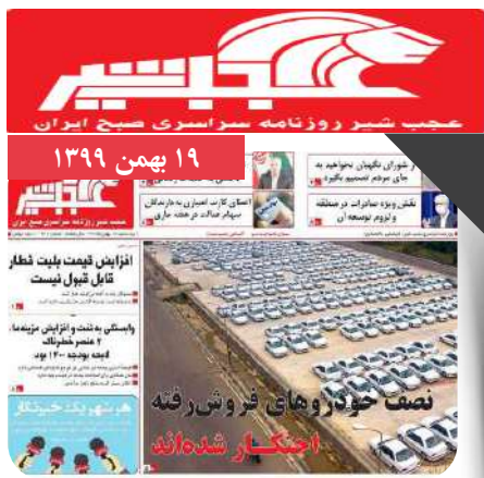
نقش ویژه صادرات در منطقه