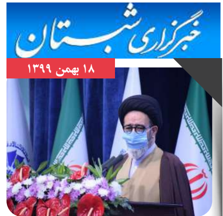
لازمه توسعه کار آفرینی مبارزه با فساد